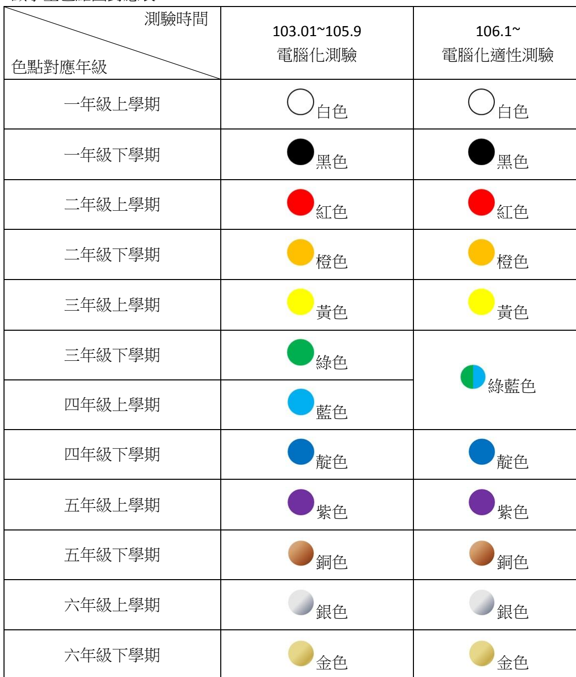
識字量色點圖對應表